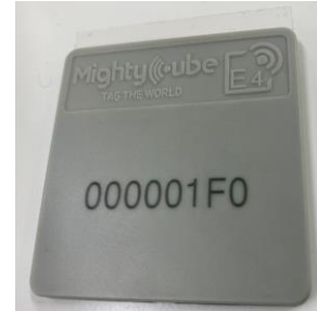
パレット用堅牢タグ TAG-X08E