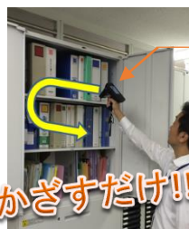
ハンディリーダーライト