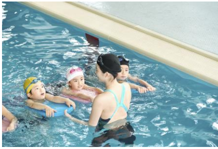
スイミングスクール